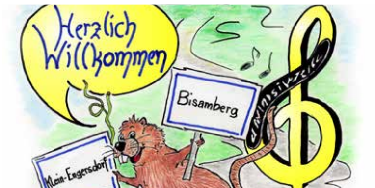
24. JVP FERIENSPIEL zum Heraustrennen S. 6

Das Team der VP Bisamberg – Klein-Engersdorf wünscht Ihnen