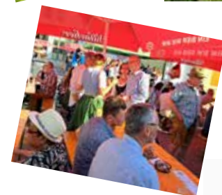
GGR Alexander Fritsch Wirtschaft, Veranstaltungen & Kleinregion