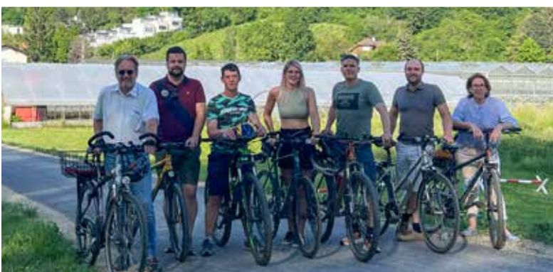
EIN BLICK AUF UNSERE AKTUELLEN PROJEKTE S. 5