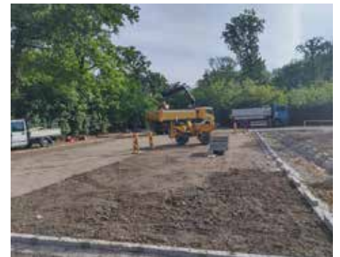
Arbeiten zur Neugestaltung des Parkplatzes Gamshöhe

Die Parkflächen selbst werden in einer Mischung aus befestigten Zu- und Abfahrtswegen und nicht versiegelten Parkplätzen, die durch Grüninseln eine aufgelockerte, aber klare Struktur (Parkplatzordnung) erhalten, neugestaltet. Damit stellen wir den Besuchern unseres Bisambergs noch vor dem Sommer wieder eine intakte und übersichtliche Parkmöglichkeit zur Verfügung.