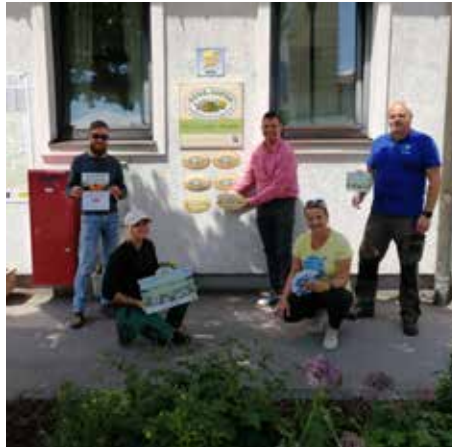
Fotos: Der 6. goldene Igel für die Marktgemeinde Bisamberg

Unsere intensiven Bemühungen, auf ökologischen Gebieten eine Vorreiterrolle einzunehmen, wurde durch die Verleihung des „Goldenen Igel 2020“ honoriert. Bisamberg wurde für seine naturnahe Bewirtschaftung der öffentlichen Grünflächen, die pestizidfrei, ohne synthetischen Düngereinsatz und ohne Torf erledigt wird, nun schon zum sechsten Mal ausgezeichnet. Dieser Preis wird an Gemeinden vergeben, die sich über den genannten Kernkriterien der Aktion „Natur im Garten“ hinaus erfolgreich einsetzen.