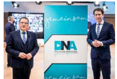
Foto: Bundesobmann August Wöginger mit Bundeskanzler Sebastian Kurz

A uch wir vom ÖAAB Bisamberg freuen uns auf die angekündigten und bereits verwirklichten Öffnungsschritte. Weiters sind wir guter Dinge, dass wir euch auf unseren zukünftigen Veranstaltungen wieder sehen.