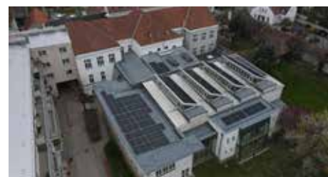
Foto: Dach der Volksschule Bisamberg