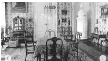
Foto: Historische Einrichtung des Bisamberger Schlosses

Die Bisamberger Spurensuche verbindet 11 Informationspunkte mit den bestehenden drei kleinen Themenwegabschnitten auf einer Gesamtlänge von rund 6,3 km. Der Weg ist zu Fuß begehbar, aber auch gut mit dem Rad befahrbar und führt asphaltiert oder gepflastert durch die Ortschaften, vorbei an Wiesen, Weinbergen und Wäldern. Die einzelnen Stationen sind mit Holzstelen und Grafiksymbolen gekennzeichnet, die mit der Handycamera abfotografiert werden können. Die App übersetzt diese Informationen und zeigt dem Gast Bild-, Film- oder 3D-Infos zum jeweiligen standortspezifischen Thema.