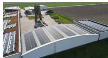
Foto: Paneelen am Dach des Bauhofs