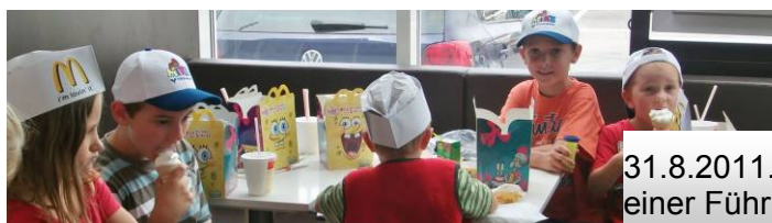
31.8.2011...MC-Donald lädt zu einer Führung nach Korneuburg