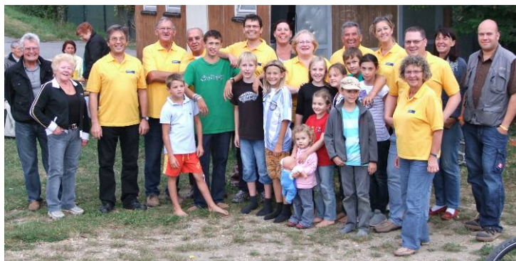
9.9.2011...Family BBQ—Grillen, Spiele u. viel Spaß