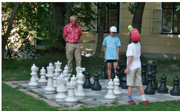
18.8.2011...Bisamberger Schachverein lädt zu Simultanpartien u. zeigt Lösung von Problemstellungen