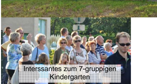
Interessantes zum 7-gruppigen Kindergarten