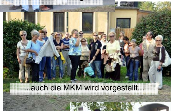
...auch die MKM wird vorgestellt...