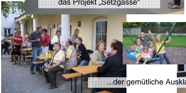
...der gemütliche Ausklang bei der „Sturmparty“