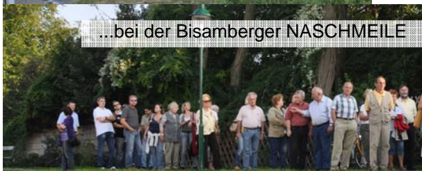
...bei der Bisamberger NASCHMEILE